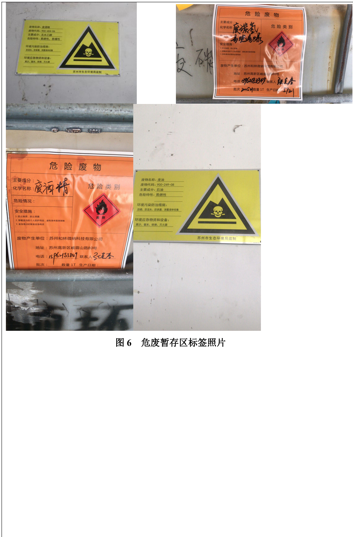
图 6 危废暂存区标签照片