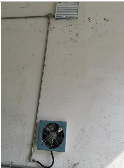
图 3 危废暂存区排风系统