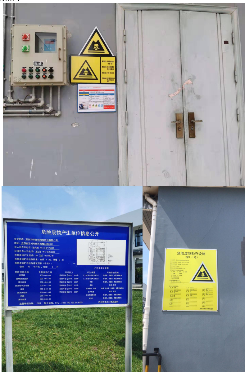
图 1 危废暂存区所外部照片