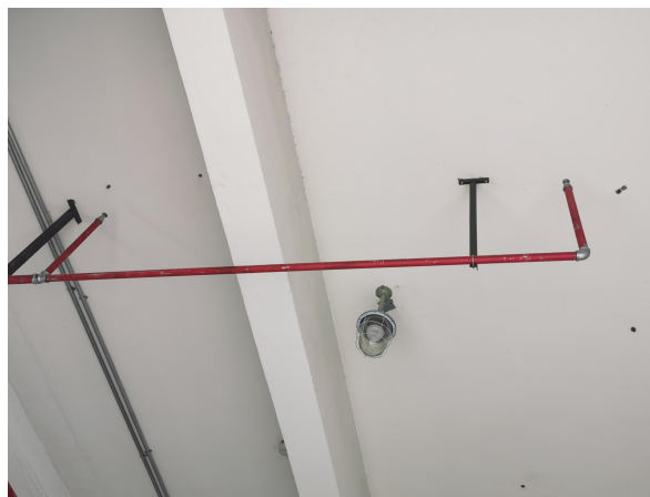
图 5 危废暂存区防爆灯照