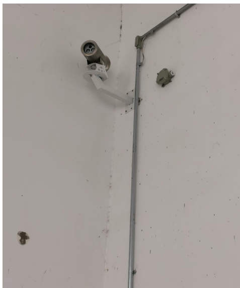
图 4 危废暂存区摄像头照片