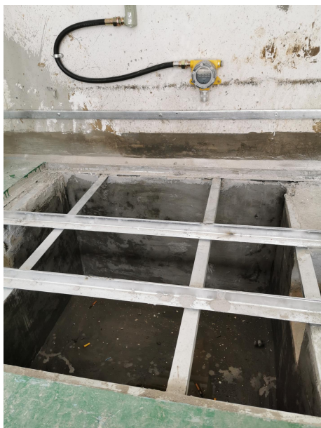
图 2 危废暂存区防泄漏槽照片