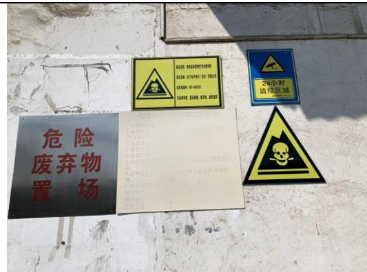
危废仓库门口标志牌