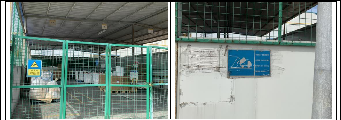
一般固体废物环保标识牌