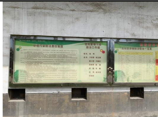
危废仓库责任制度