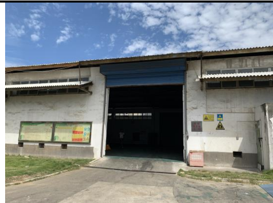
危废仓库现场照片