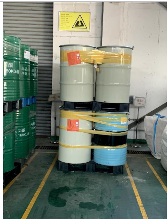
危废仓库内部不同类危废分类存放、设置环氧地坪