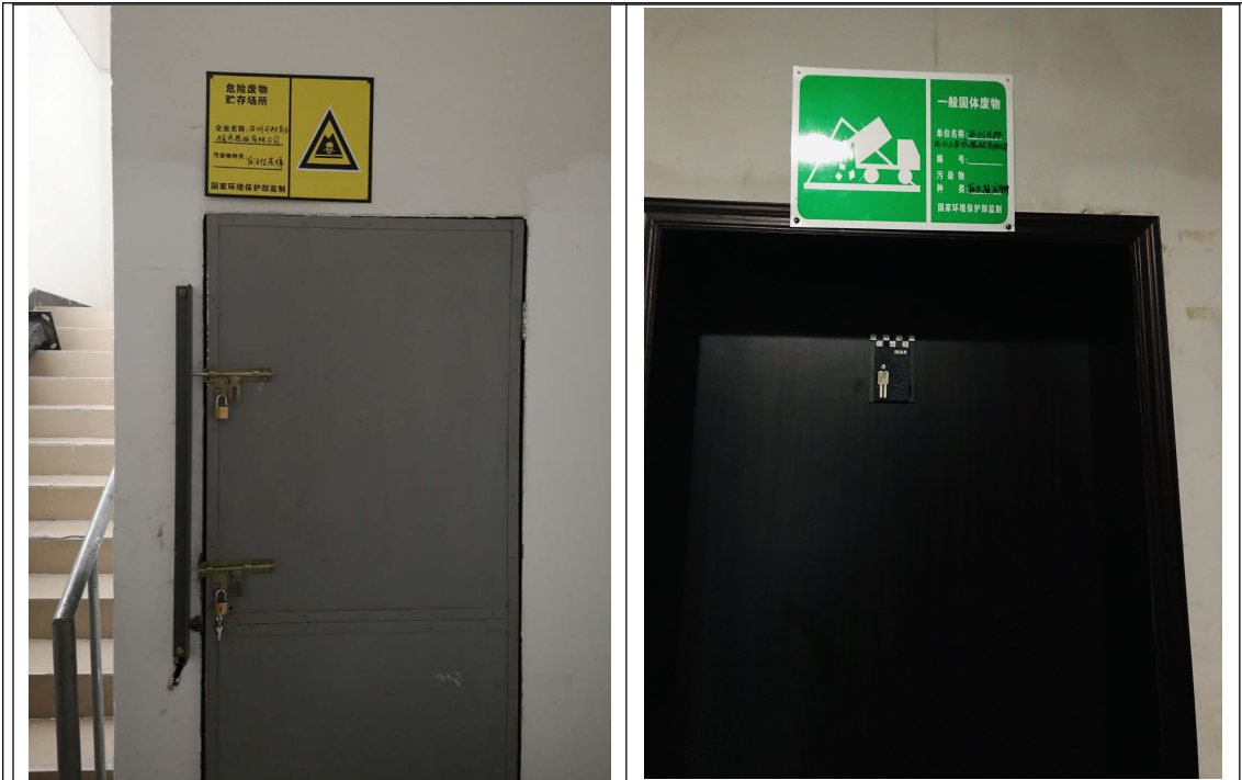
图 3-1 危废暂存间