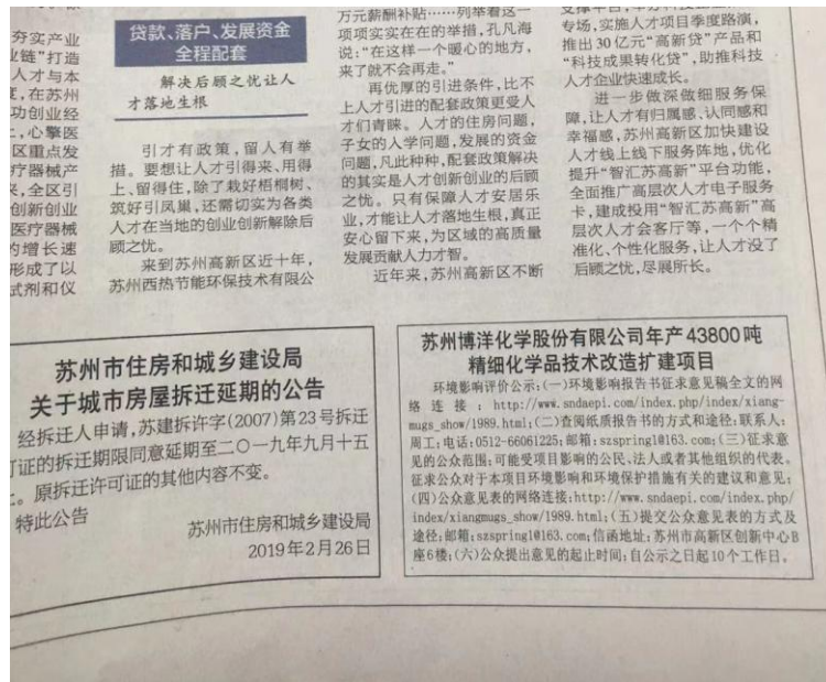
图3-2 2019年2月27日登报公示

在项目环评征求意见稿公示同期，分别于 2019 年 2 月 27 日及 2019 年 2 月 28 日在《苏州日报》上刊登了项目环境影响评价公开信息，见图 3-2 和图 3-3。在媒体刊登公告后，未收到任何公众反馈意见。