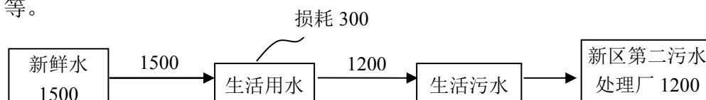
图 5-2 水量平衡图(t/a)

项目废水只有生活污水，项目建成后共有职工 50 人，本报告平均以每人每天用水 100 升计算，年工作日 300 天计，则全年生活用水量约 1500 吨，产生的生活污水按用水量的 80% 计，生活污水排放量约 1200 吨/年，主要污染物为 COD、SS、氨氮、TP 等。