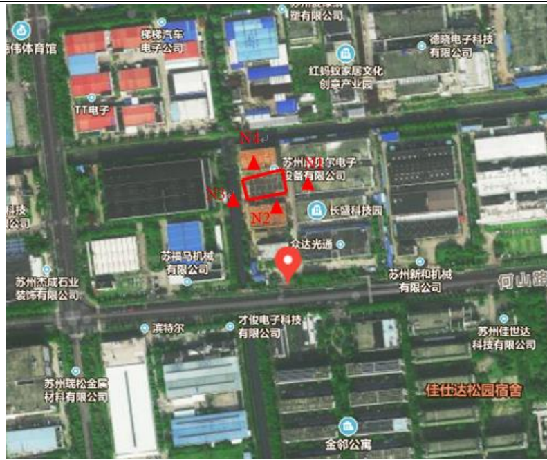
图 3-1 监测点位布置图